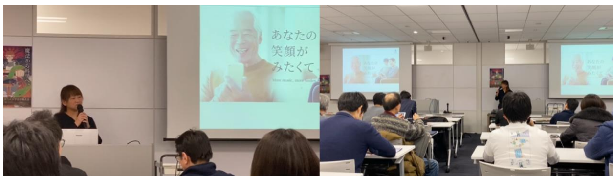
【デジタルヘルス学会学術大会での講演】

そのような中で、認知症に対する音楽療法を実施している医療機関はまだ限られており、「自宅でできる音楽療法のようなプログラムがあれば」とのご要望から、「音楽回想法」サービスは、遠方からの通院が困難な方や、通院後に自宅でも継続して音楽療法プログラムをライフスタイルに取り入れることができるサポートツールとして開発されました。そして「音楽回想法」サービスは、おかげさまでこのたびサービス開始から3周年を迎えます。さらに充実した機能をご利用いただけるよう、2021年9月1日より全楽曲およびフル機能を無料提供いたします。「音楽回想法」は、QOLの向上に役立つだけでなく、懐かしい曲を聴いたり歌ったりしながら、その曲にまつわる思い出に花を咲かせるコミュニケーションツールとしても有用であると考えています。